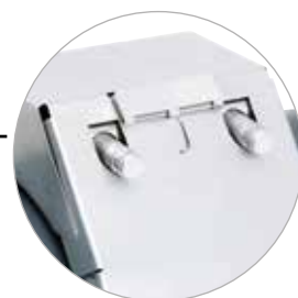
Las protecciones de doble bloqueo evitan el desmontaje accidental